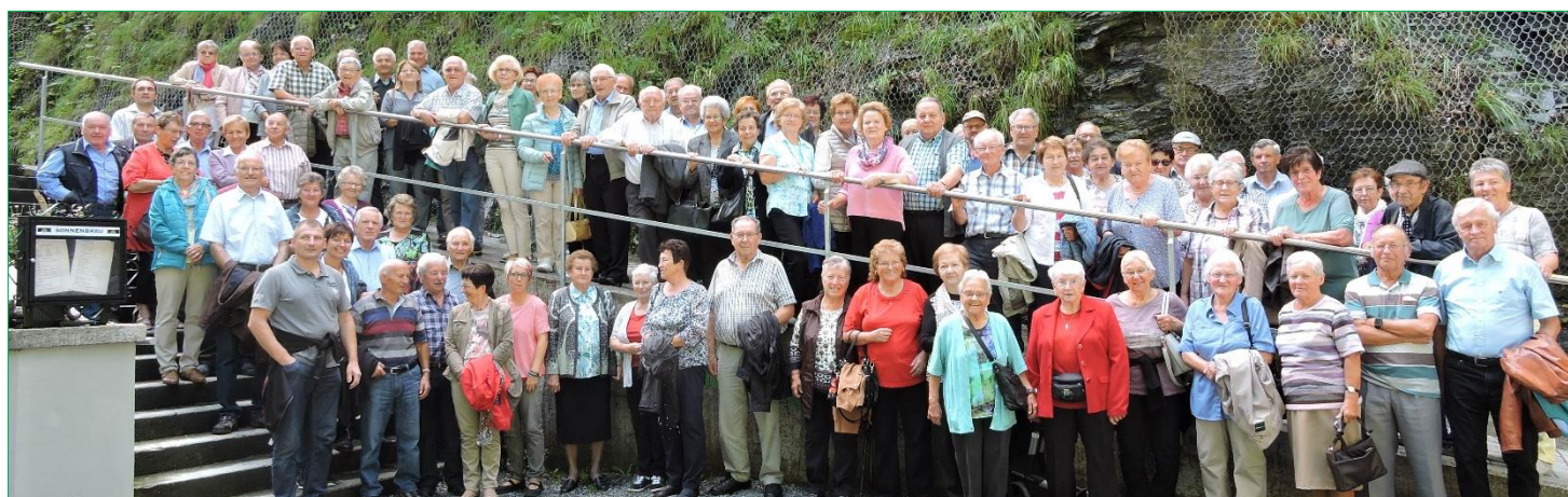
Seniorenausflug in die Taminaschlucht