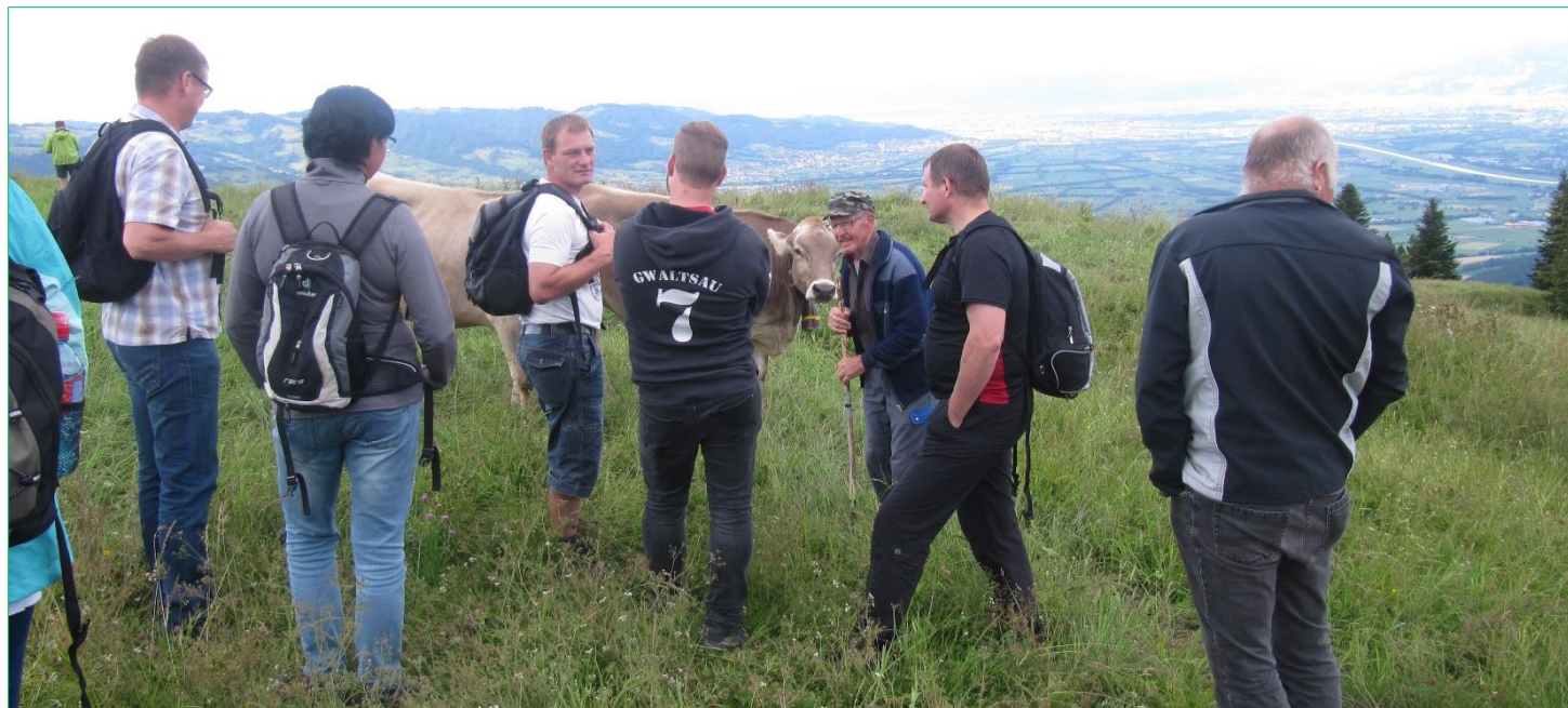
Alp- und Waldbegehung des Ortsverwaltungsrates mit der Geschäftsprüfungskommission