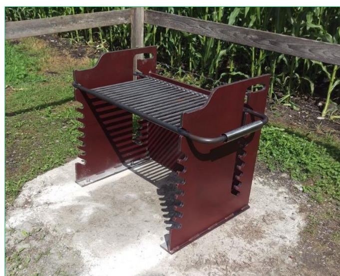
Eichbergerhütte mit neuer Grillstelle