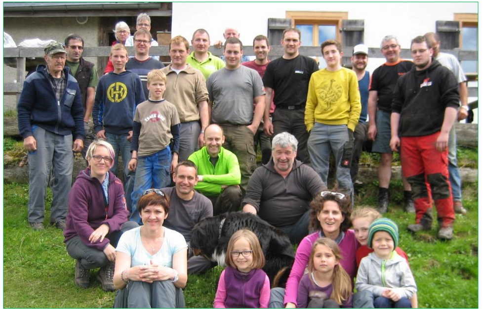
Toller 13. Alptag auf dem Kriessner Schwamm