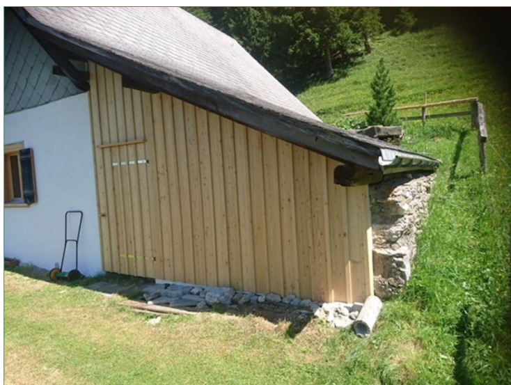
Alphütte mit neuer Fassade