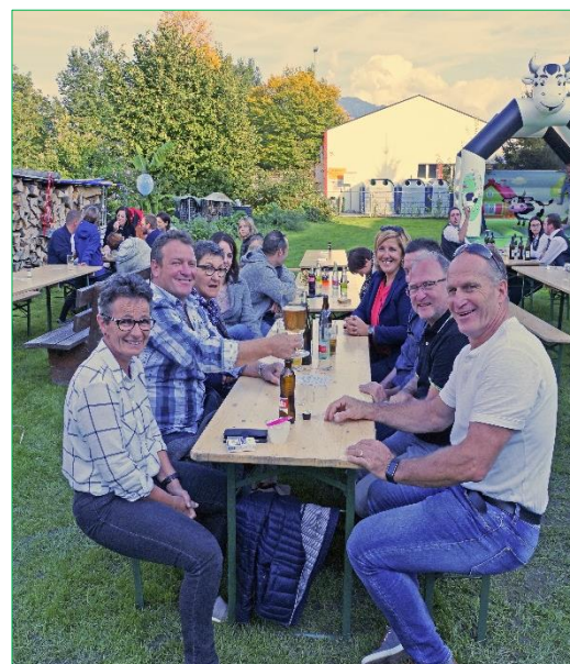
Gelungenes Kriessner Kilbifest