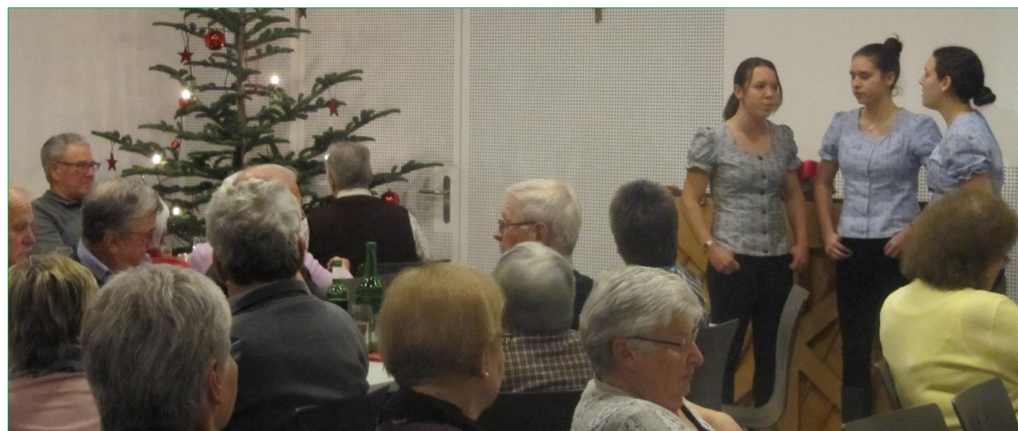
Seniorenweihnachtsfeier im Pfarreizentrum