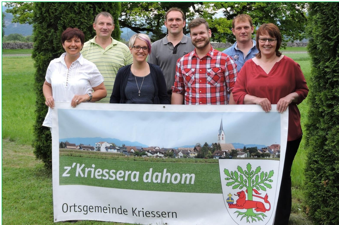
Ortsverwaltungsrat für die Amtsdauer 2017 - 2020