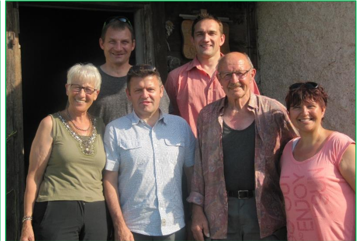
Jährliche Alpbegehung des Ortsverwaltungsrates mit Besprechung vor Ort