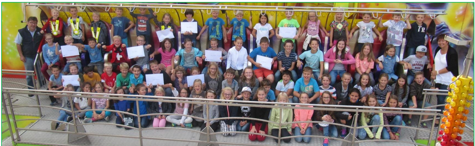
Kilbi-Gratisbillette für die Kriessner Schulkinder