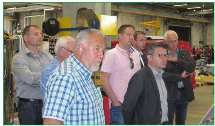
Frühjahrsversammlung Rheintaler Ortspräsidenten