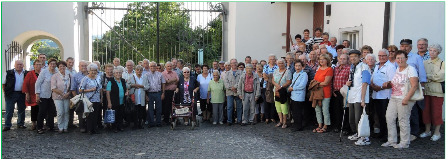
Seniorenausflug in die Kartause Ittingen