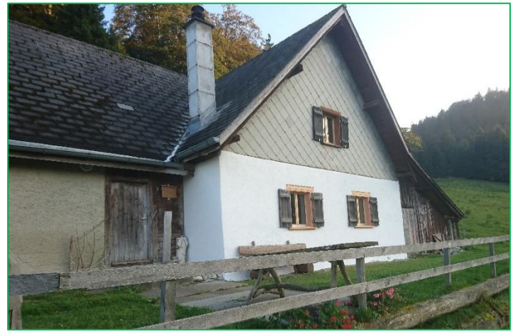
Erfolgreiche Teilsanierung der Alphütten-Fassade