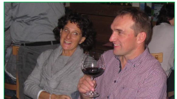
Weihnachtssessen des Ortsverwaltungsrates und der Geschäftsprüfungskommission