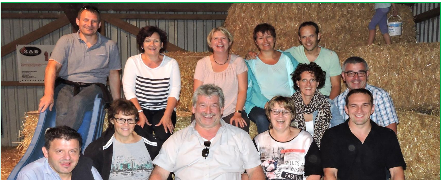
Ortsverwaltungsrat auf Kulturreise im Bieler Seeland